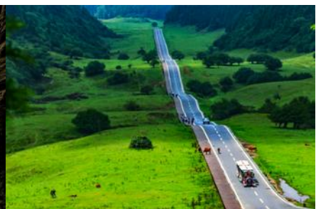
อุทยานเขาเนาฟ้า