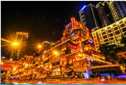
ย่านหงหยาดัง