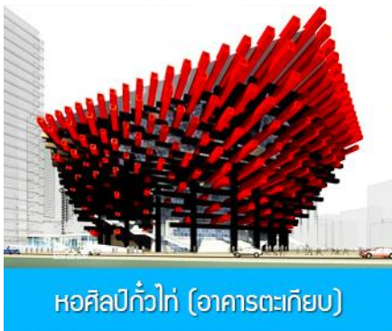
หอศิลป์กั๋วไท่ (อาคารตะเกียบ)