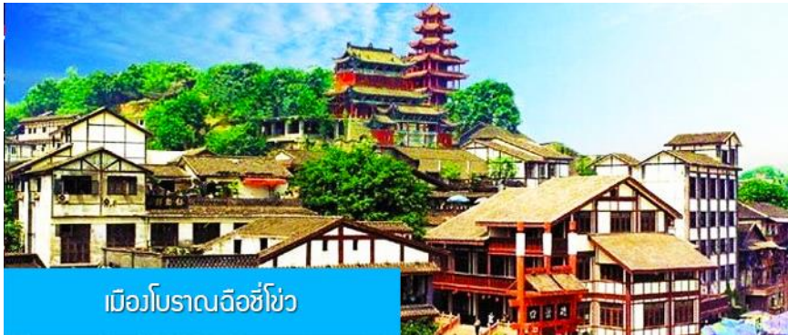
เมืองโบราณฉือชี่โข่ว

พักที่ BORRMAN HOTEL โรงแรมระดับ 4 ดาวหรือเทียบเท่าในเมืองฉงชิ่ง