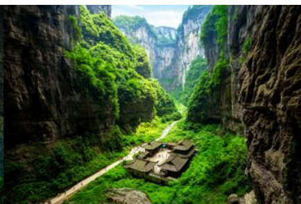
สะพานธรรมชาติสามแห่ง