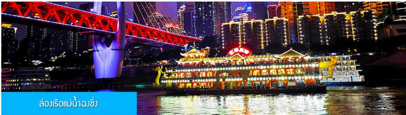
ล่องเรือแม่น้ำจิ่ง

OPTIONAL TOUR ไกด์ขายล่องเรือแม่น้ำจิ่ง ชมความสวยงามของสองริมฝั่งแม่น้ำเมืองจิ่ง ล่องเรือ ท่านละ 280 หยวน หรือประมาณ 1,400 บาท