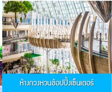
ห้างกวงหวนช้อปปิ้งเซ็นเตอร์

วันที่ห้า เมืองฉงชิ่ง-เมืองโบราณฉือชี่โข่ว-กวงหวนช้อปปิ้งคอมเพล็กซ์ –บินกลับกรุงเทพ (ดอนเมือง)