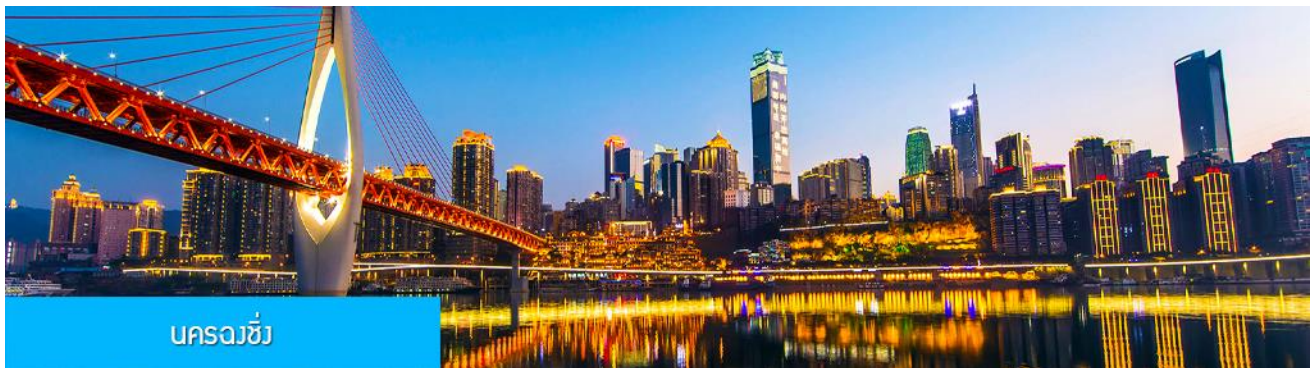
นครฉงชิ่ง