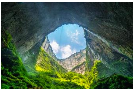
อุทยานหลุมฟ้า