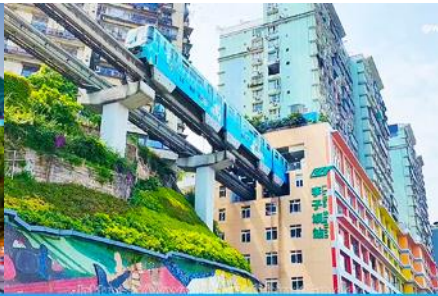
รถไฟวิงทะเลติก